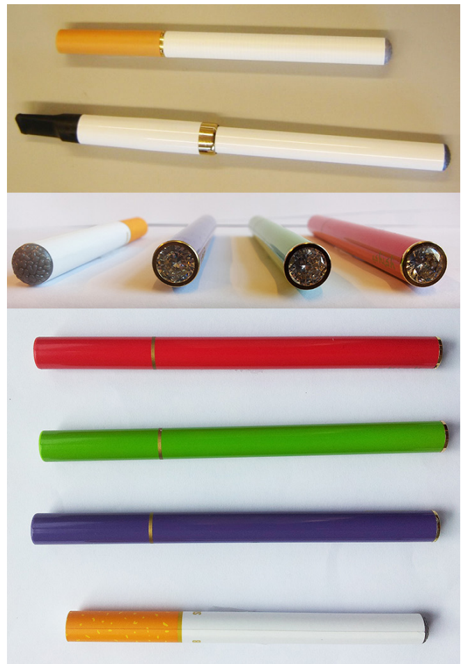
Figuur 3: voorbeelden van verschillende soorten e-sigaretten.

Hoewel e-sigaretten zijn bedoeld voor mensen boven de 18, is hier geen echte controle op. Op dit moment zijn er geen wetten om deze leeftijdsgrens verplicht te stellen.